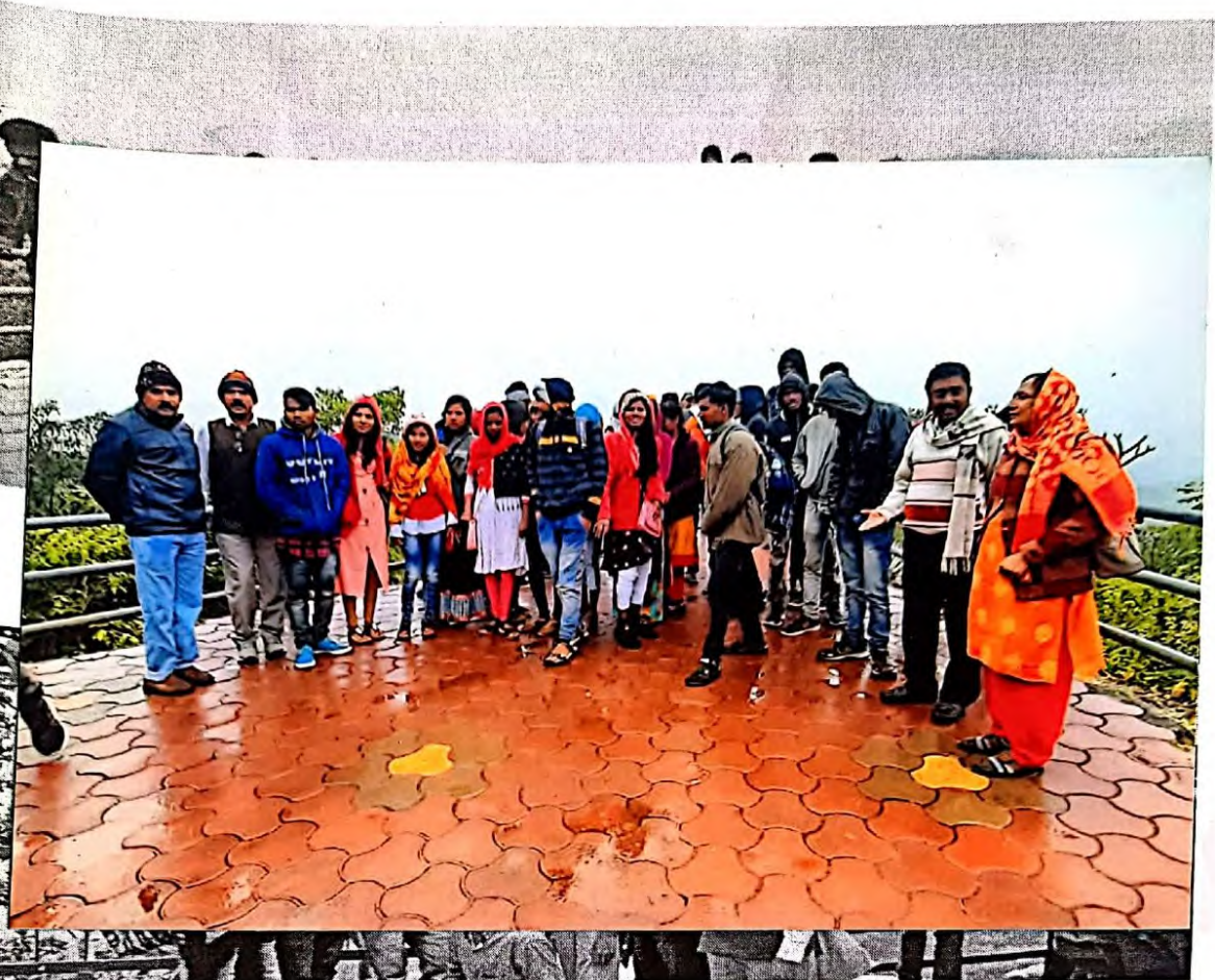
Moments of group photo students and teachers at Panchamahadi