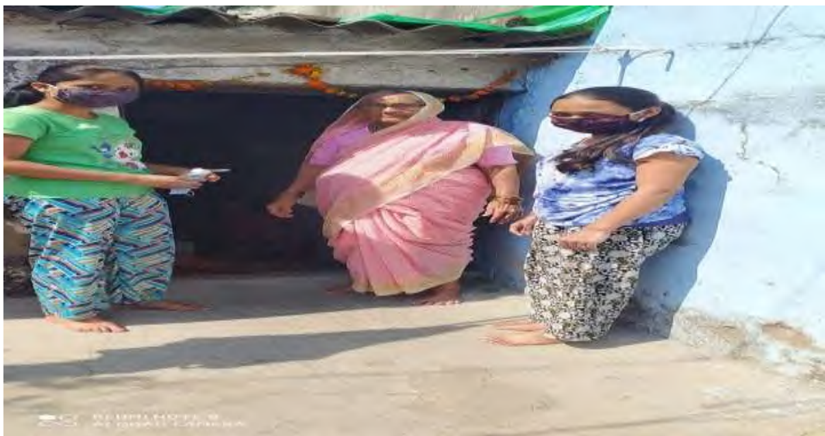
Students telling the importance of sanitization and Sanitizer distribution by students