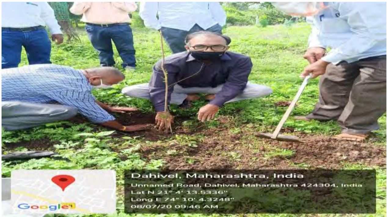
Tree Plantation Program: Date-07/07/202