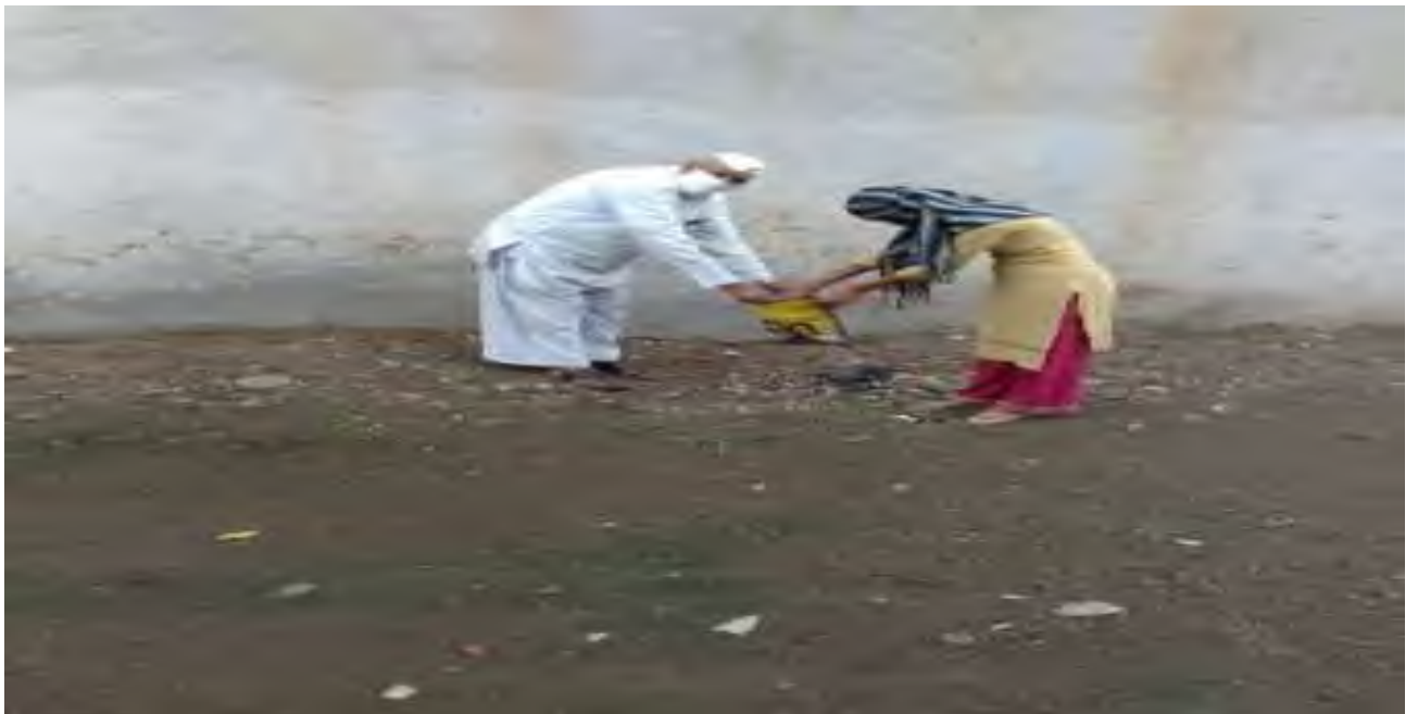
Plastic eradication by students at Dahivel village