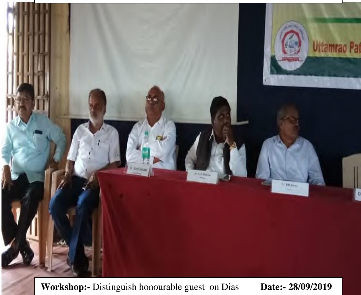
Workshop:- Distinguish honourable guest on Dias Date:- 28/09/2019