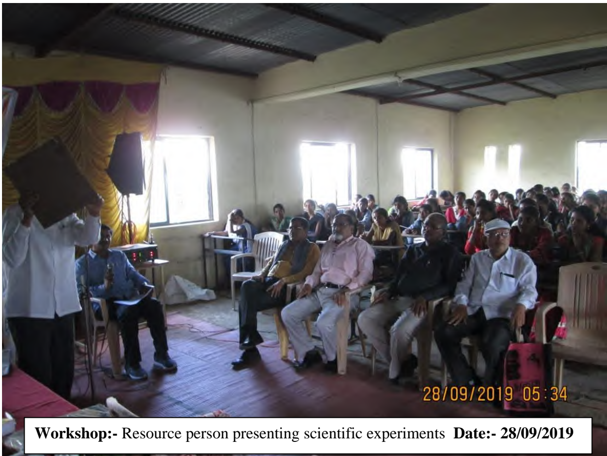
Workshop:- Resource person presenting scientific experiments Date:- 28/09/2019