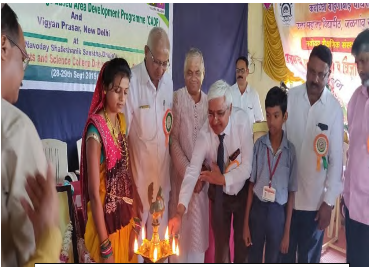
Workshop:- Inauguration ceremony of program with Honourable Guests Date:- 28/09/2019