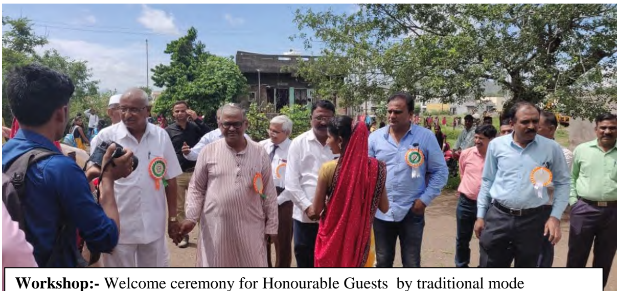
Workshop:- Welcome ceremony for Honourable Guests by traditional mode Date:- 28/09/2019