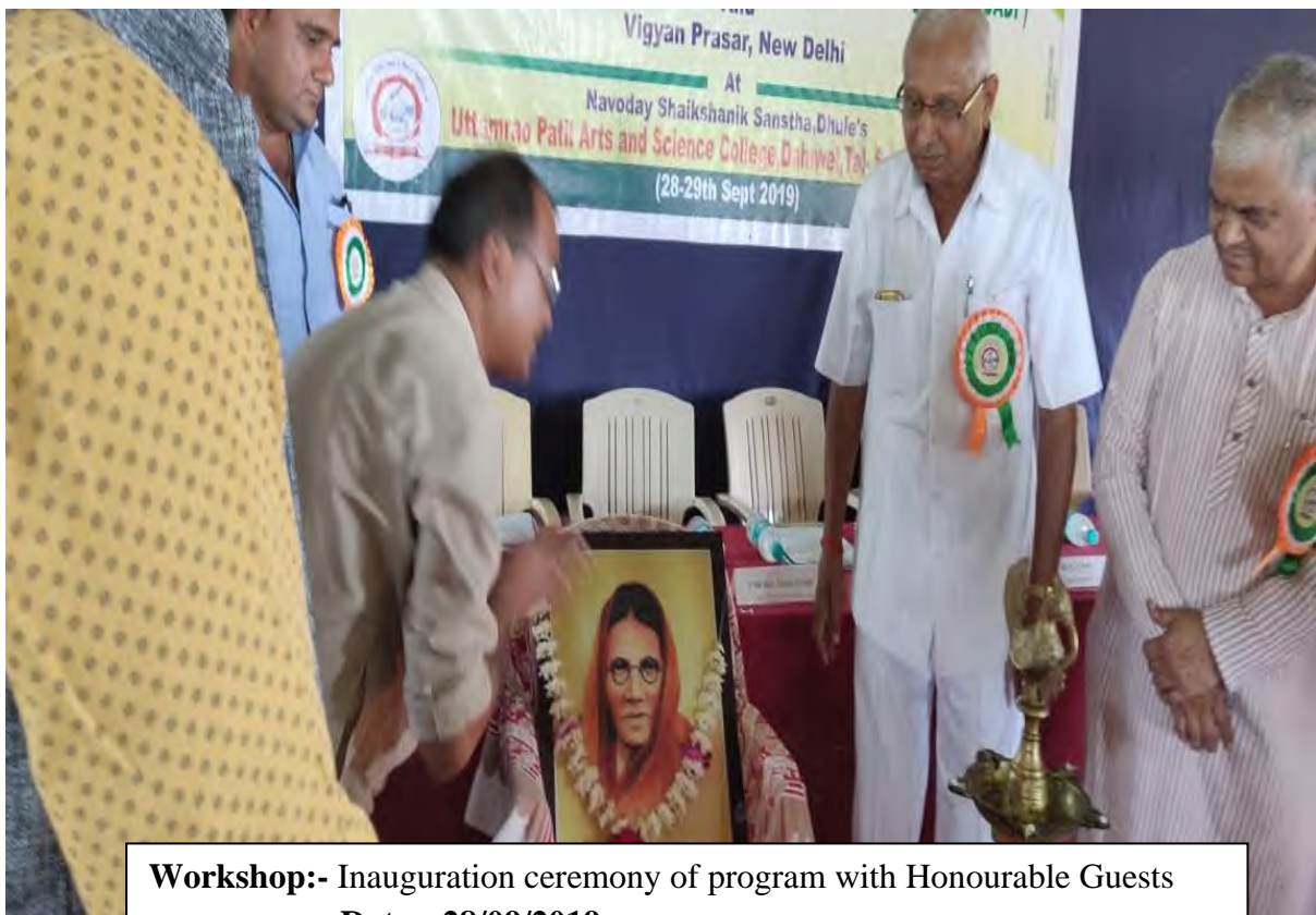
Workshop:- Inauguration ceremony of program with Honourable Guests Date:- 28/09/2019