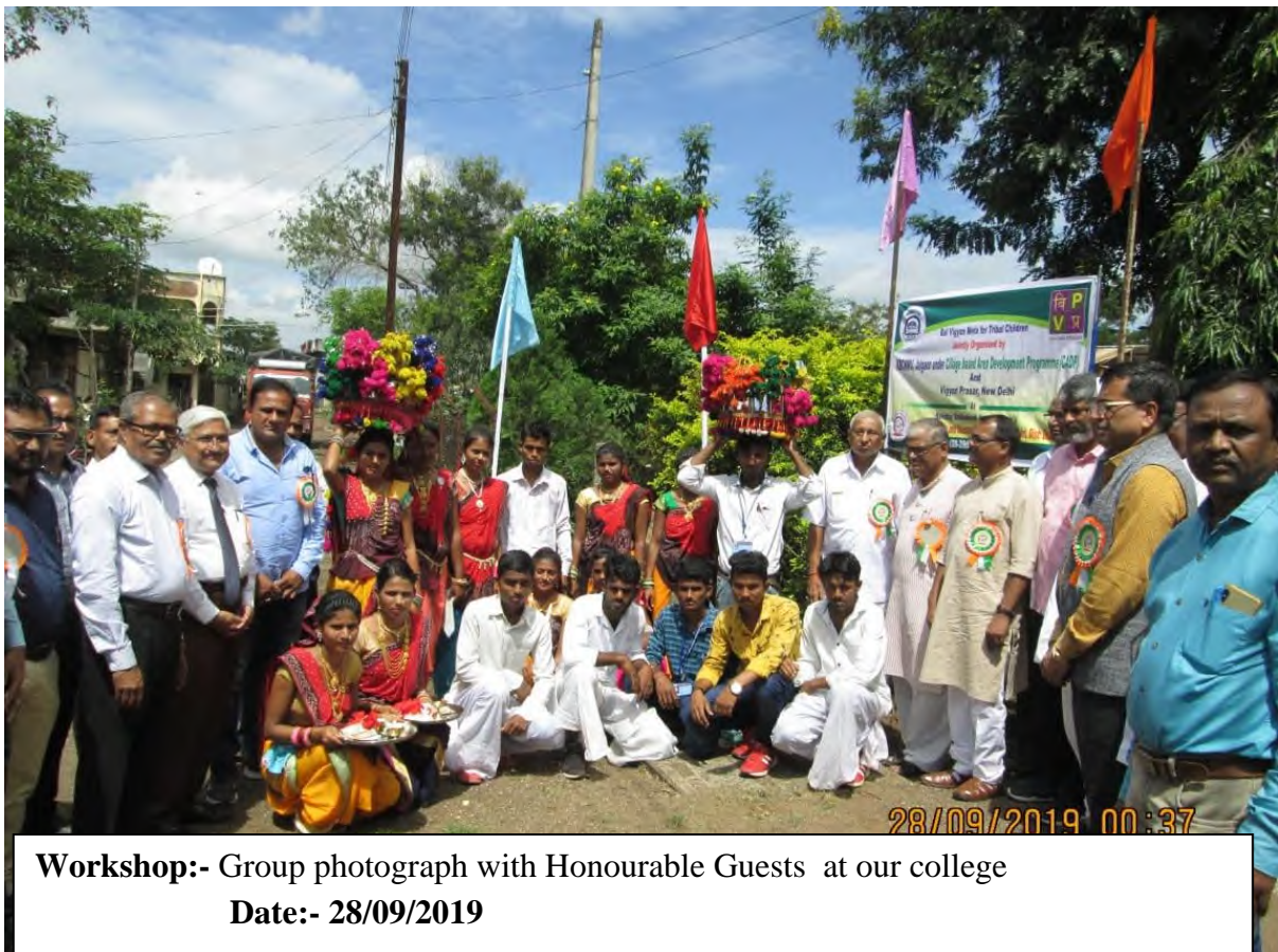
Workshop:- Group photograph with Honourable Guests at our college Date:- 28/09/2019