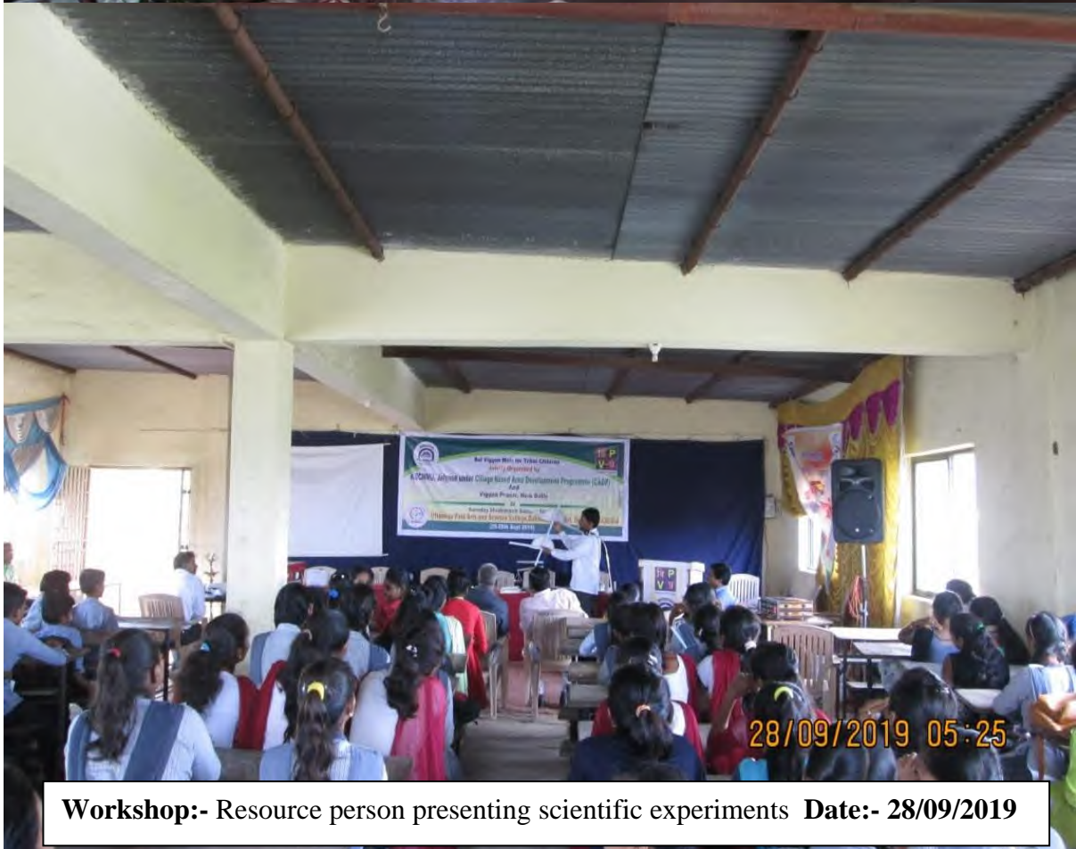
Workshop:- Resource person presenting scientific experiments Date:- 28/09/2019