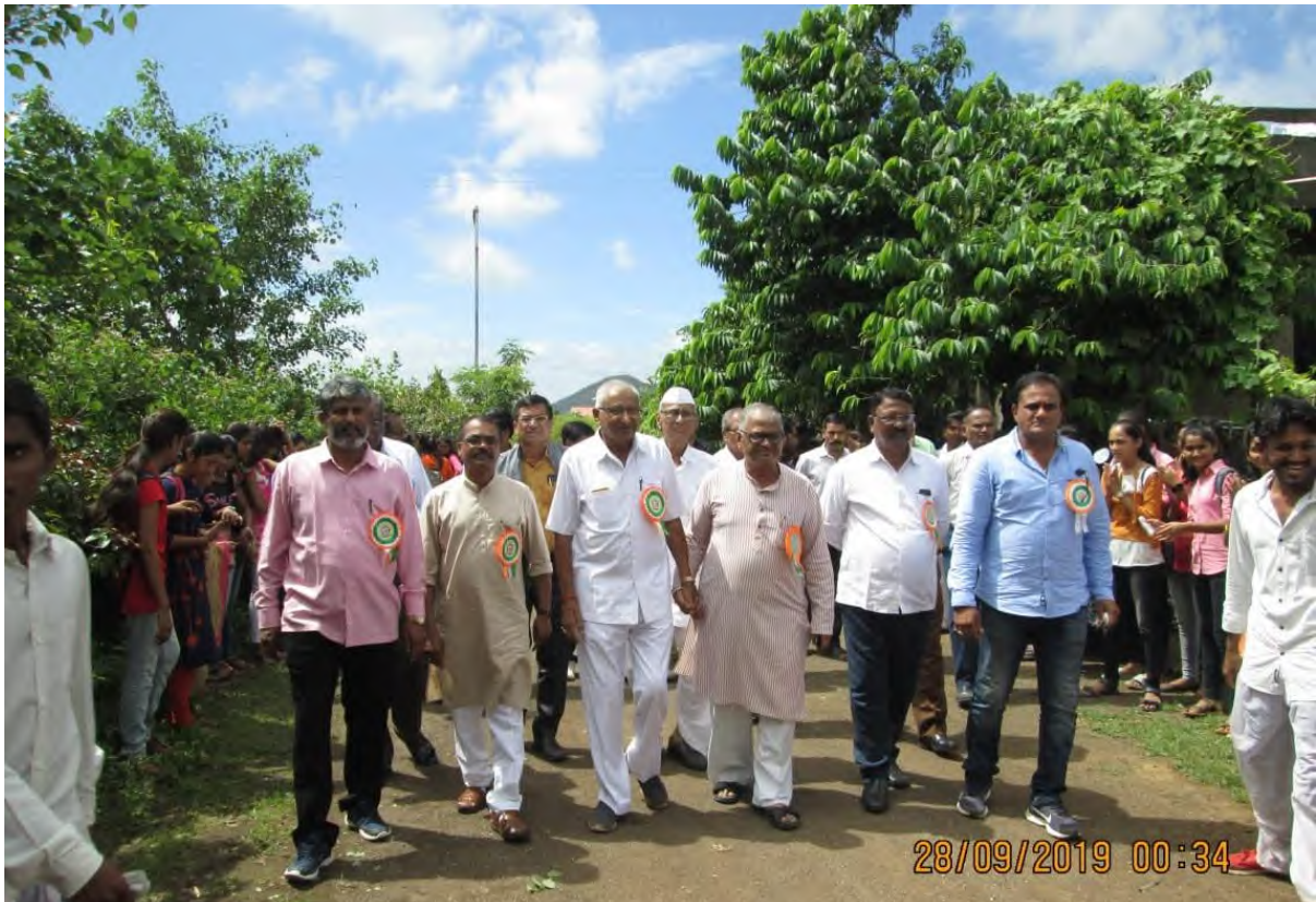
Workshop:- Welcome ceremony for Honourable Guests on workshop Date:- 28/09/2019