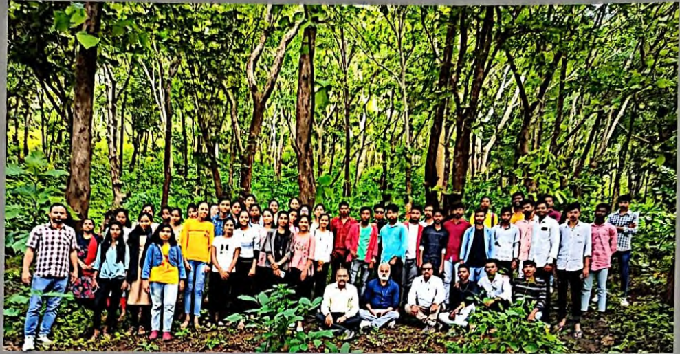
Group photo at Baripada forest