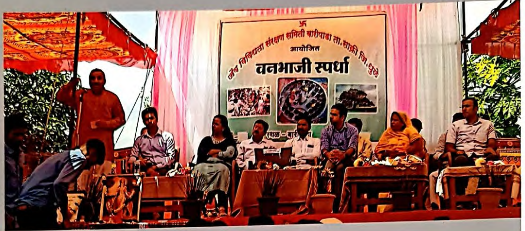
"Vanbhaji" festival inauguration in presence of DMO Dhule district.