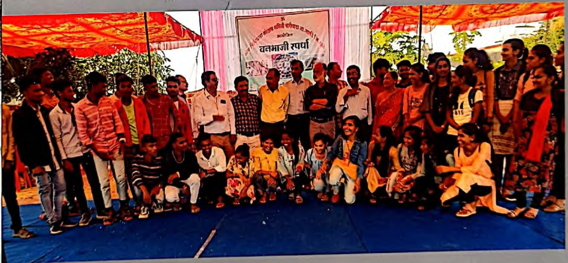
Group photo at "Vanbhaji" festival Baripada