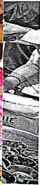
Students enjoying the "Vanbhaji" Festival at Baripada