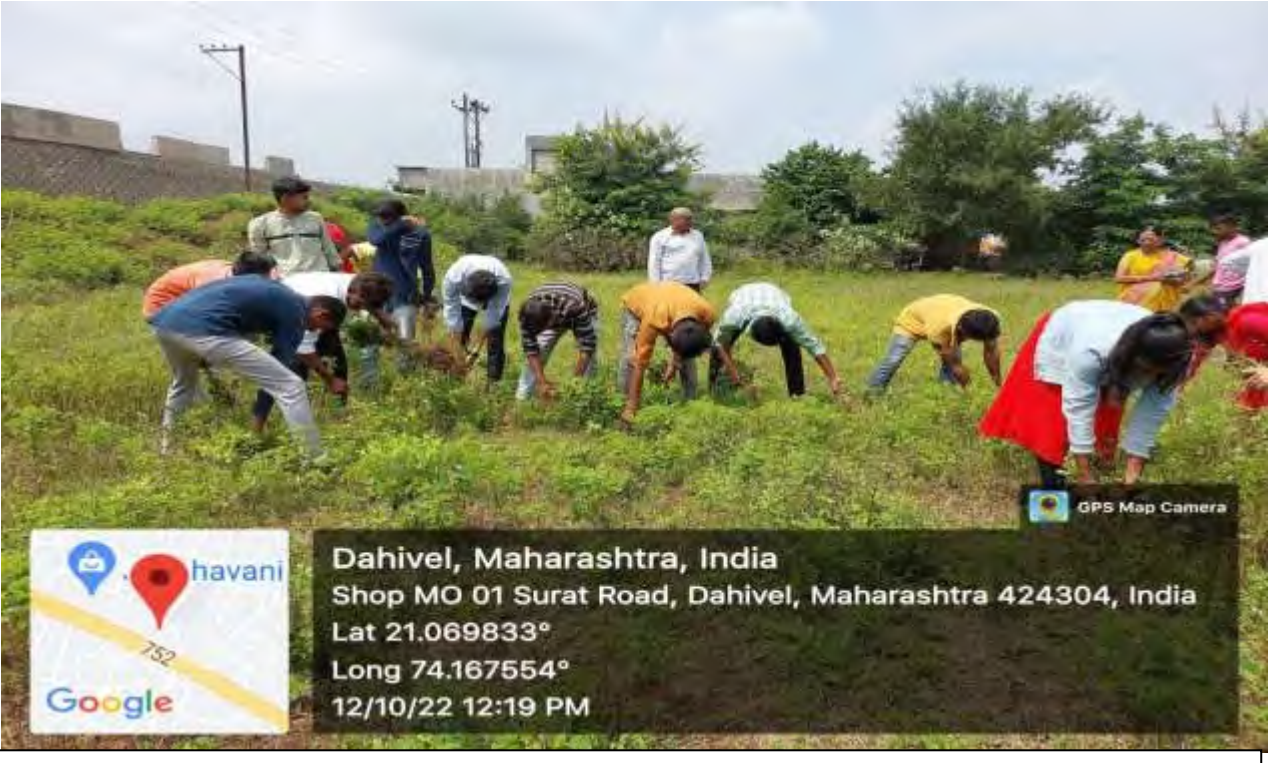
NSS ,Students participated in Swachha Bharat Abhiyan at College campus cleaning