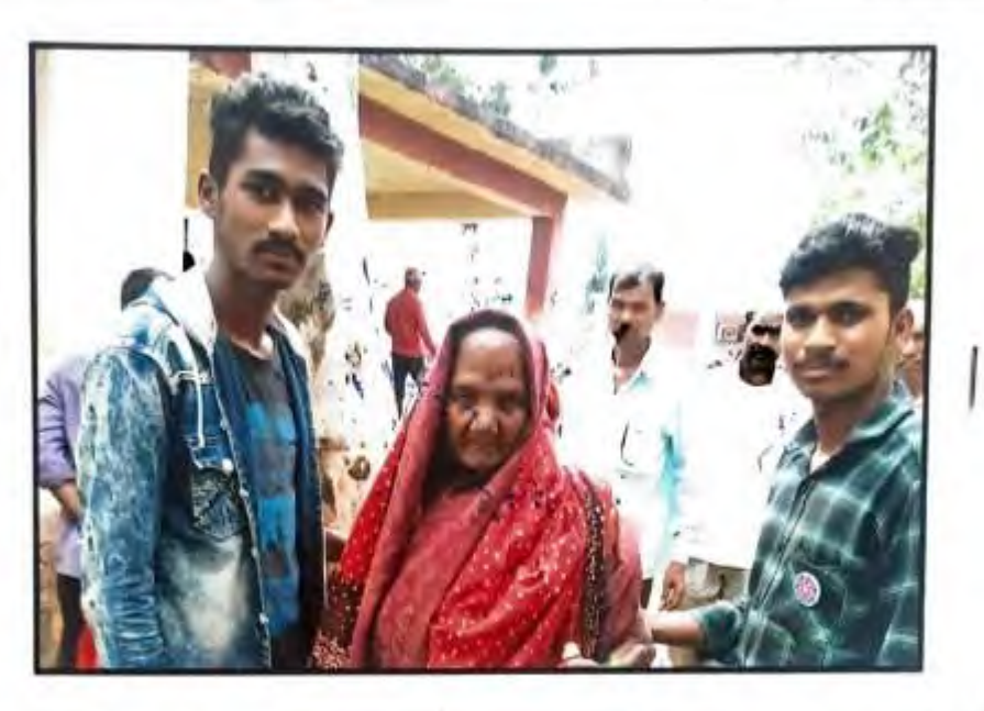
मनि- र्यारे आनाहा हराना व दिमार महाट मेलादा- बोरकी 2013ी